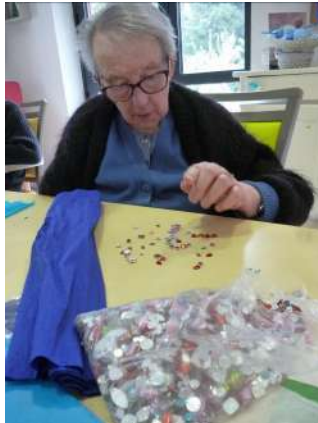
Fleurs en papier crépon en bleu