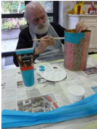
Peinture sur pot, de couleur bleue

La semaine du 4 au 10 octobre, nous fêtons la semaine bleue « NOTRE SEMAINE ». Cette année nous avons continué nos activités en la marquant de BLEUE . Nos ateliers peinture, nos fleurs en papier crépons et nos séances de gymnastique.