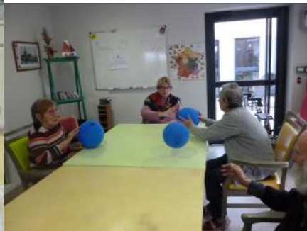
Gymnastique avec ballons bleus